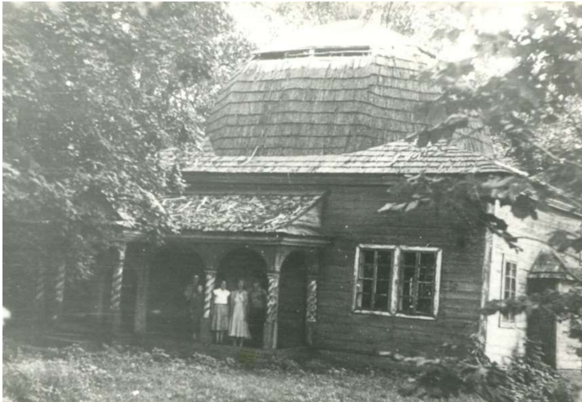
Стан мячэці ў 1970-ыя

У 1989 годзе спецыялісты 41 падрыхтавалі праект аднаўлення мячэці, склалі каштарыс на 67 тысяч рублёў. Планавалася, што яна будзе узведзеная ў Строчыцах з 1990 да 1991 год, але да сённяшняга дня гэта не зроблена.