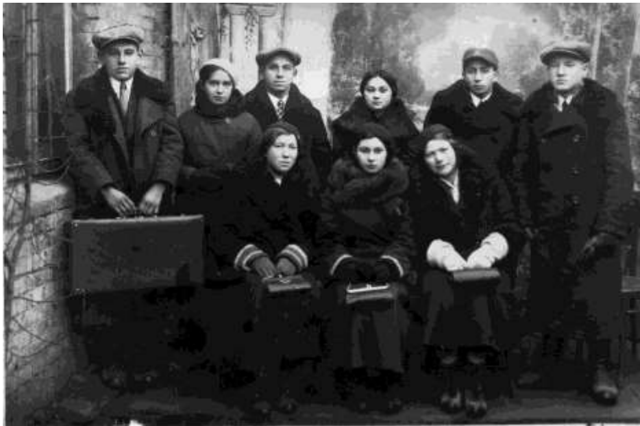
Баль на Ластаі