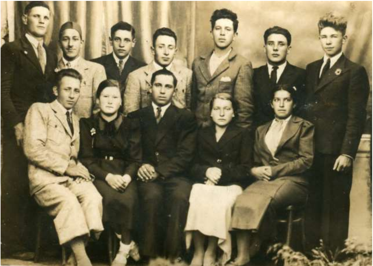
Татары з Крэва, Ашмянаў, Кярвеляў і інш.