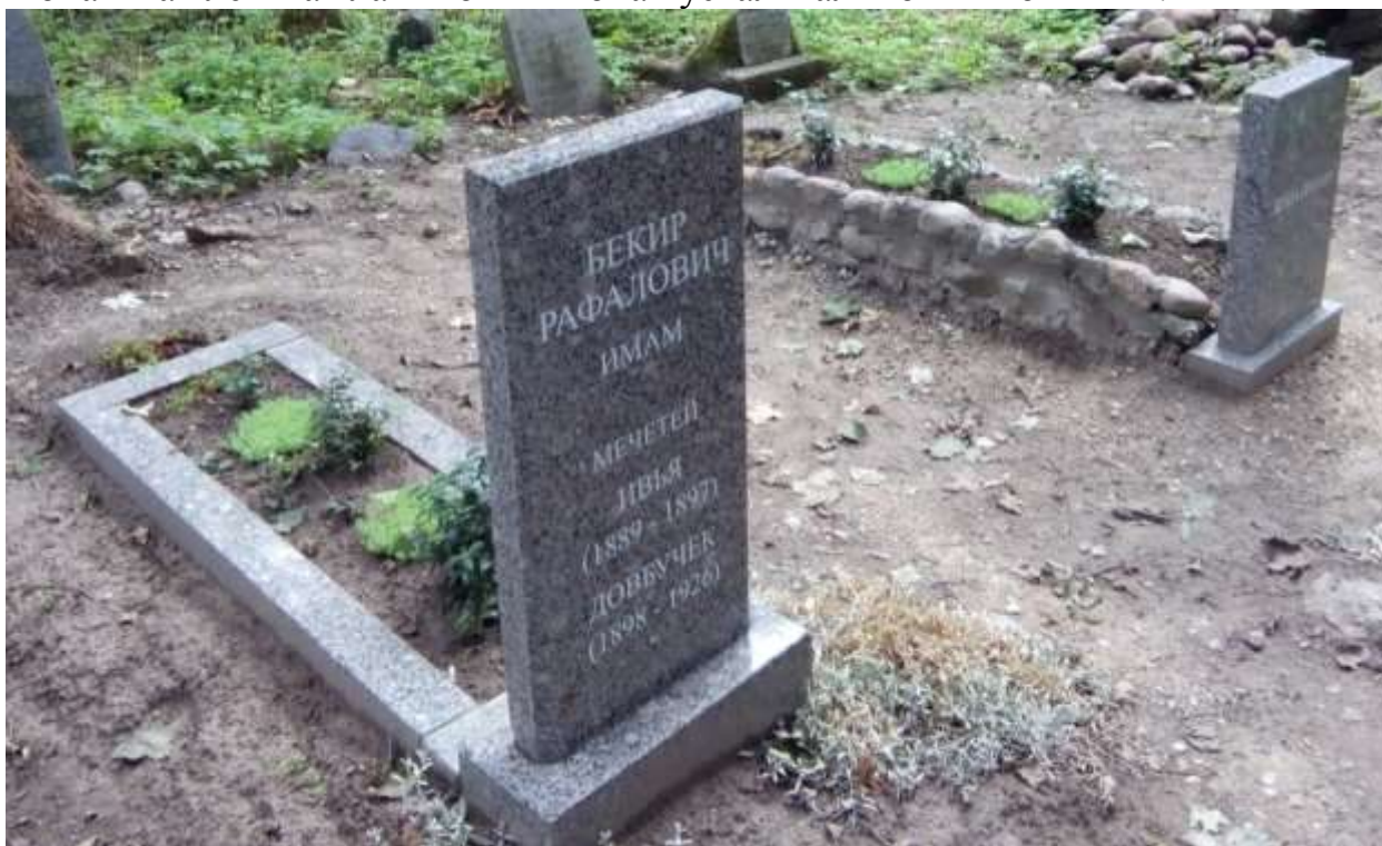
Магіла імама Б.М. Рафаловіча

Імам Рафаловіч пахаваны на мізары ў Даўбуцішках, а ў 2018 годзе на ягонай магіле і магілах ягоных жонак усталявалі новыя помнікі 61 .