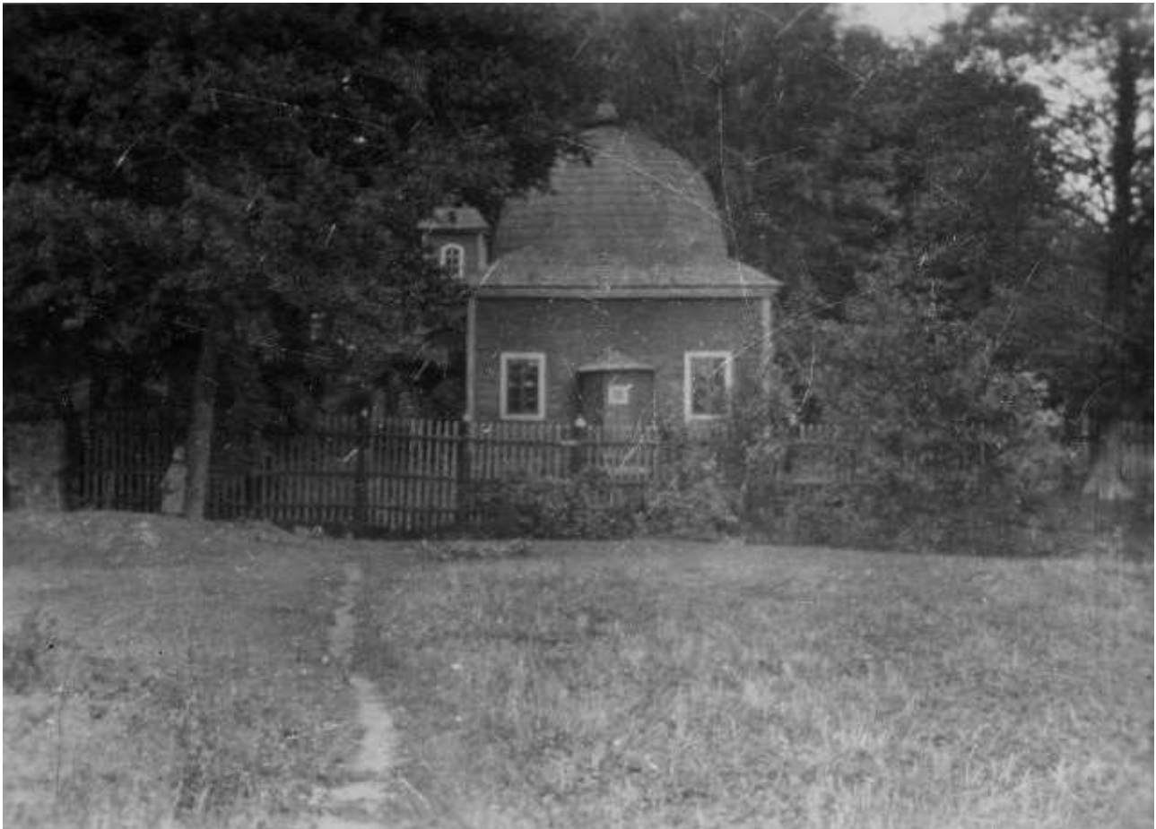
Мячэць. Выгляд з паўднёвага боку.

Пасля таго, як у міжваенны час мячэць дадалі ў спіс помнікаў, яна атрымала ахоўны статус, таму рамонт і іншыя працы з будынкам абавязкова павінны былі выконвацца толькі з дазволу ўправы ваяводства.