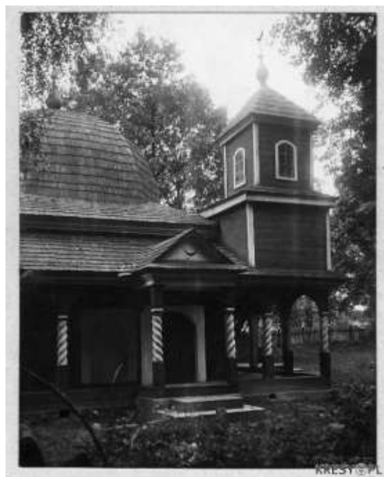
Выгляд з паўночнага боку