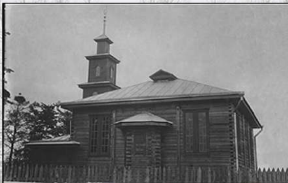
Мечеть в Видзах. 1938 год

Мечеть построена в 1857 году, сгорела во время Первой мировой. В 1927 построен молитвенный дом, а в 1934 – новая мечеть. После 1944 года здание национализировано, а в 1967 полностью разобрано.