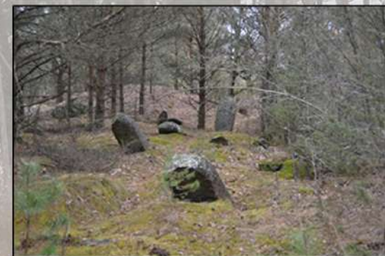
Мизар в ур. Каролин

В урочище Каролин возле деревни Камено Вилейского района Минской области находится уникальный памятник истории республиканского значения – курганный могильник IX – XI веков.