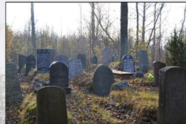
Мизар в Мяделе. Общий вид старой части

Мизар находится возле деревни Гирины на берегу озера Мястро. Заложен в начале XIX века. Около 400 захоронений, самое старое датировано 1828 годом.