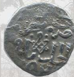
Серебряная монета - Дирхем хана Тохтамышша с арабской вязью.

Так в 1410 г. в Грюндвальской битве татарские хоругви помогли одержать победу над крестоносцами, за что Великий князь Витовт щедро наградил их землями и дворянскими званиями. Именно с этого времени на территории Беларуси начала складываться татарская мусульманская община.