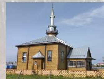
Мечеть в Ивье Построена в 1884 году.